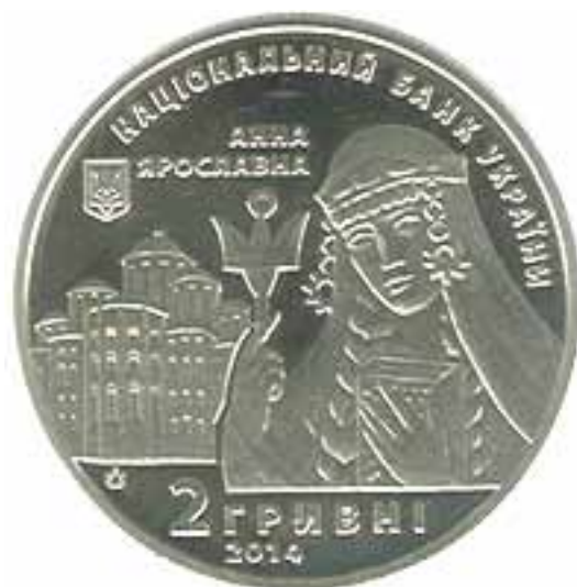
Монета , аверс 2014 рік