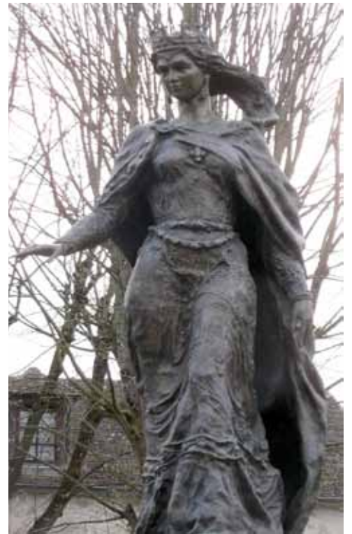
Пам'ятник Анні Ярославні в Санлісі (Франція) «Анна Київська, королева Франції» (відкрито у 2005 році)