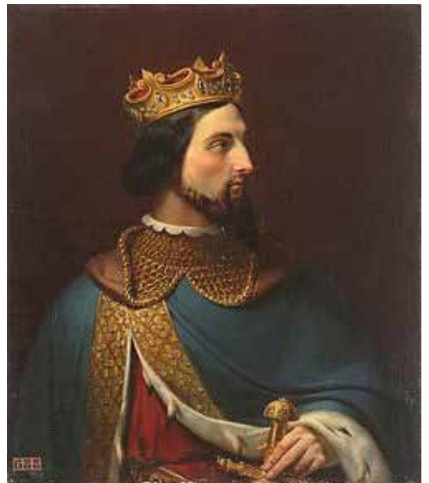
Король Франції Генріх I