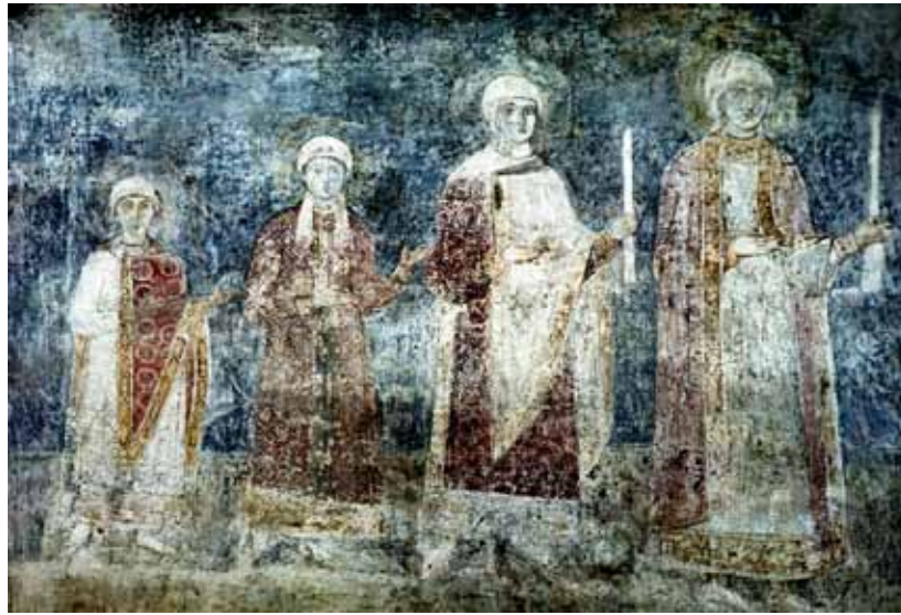
Фреска із зображенням дочок Ярослава Мудрого в Софіївському соборі