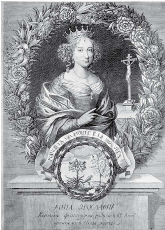
Анна Ярославна невідомий художник, 1884 р.