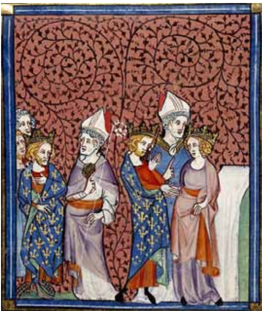
Шлюб Анни і Генріха мініатюра, «Хроніки Сен-Дені», XIV ст.