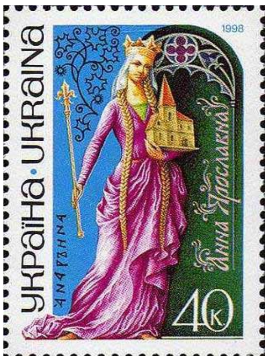
Поштова марка 1998 рік