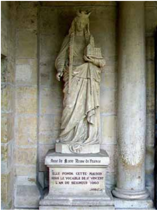
Пам'ятник Анні Ярославні в Санлісі (Франція), монастир св. Вікентія «Анна Київська, королева Франції» (відкрито у XVII ст.)