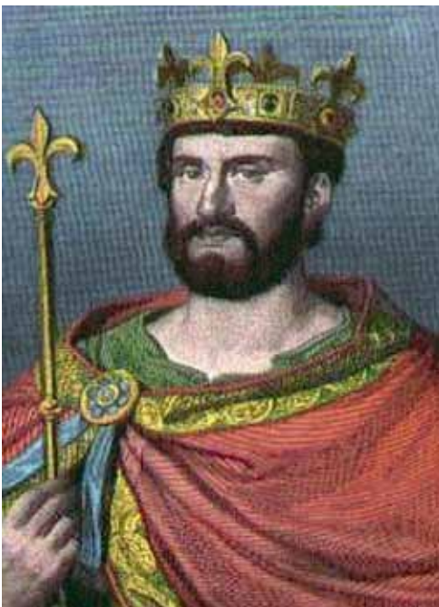
Син Анни Ярославни Філіпп I - король Франції

Сини зростали, та одного дня їх мати – королева Франції – раптово зникла. Поїхавши на полювання, Анна Ярославна таємно одружилася з ворогом свого покійного чоловіка, графом Раулем Де Валуа. Всупереч забороні церкви вони прожили у його замку десять років, вона допомагала сину Філіпу керувати країною, проте репутація її була зіпсована назавжди. Багато років її засуджували та виправдовували, але минув час і зрештою всі, навіть діти пробачили їй усе: вільну поведінку та не зовсім жіночий спосіб життя, любов до коней, полювання, лицарських боїв та заборонене кохання. Після смерті другого чоловіка Анна Ярославна переїхала до свого сина Філіпа, але дорослий король вже не потребував порад старої матері, колишньої королеви Франції. Повернувшись до свого монастиря, вона ще деякий час там перебувала, а потім зникла вдруге і востаннє. Де доживала віку та де похована Анна Ярославна достеменно невідомо.