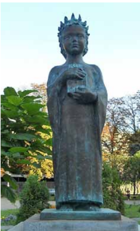
Пам'ятник Анні Ярославні-дитині в Києві «Анна Ярославна» (відкрито у 2016 році)