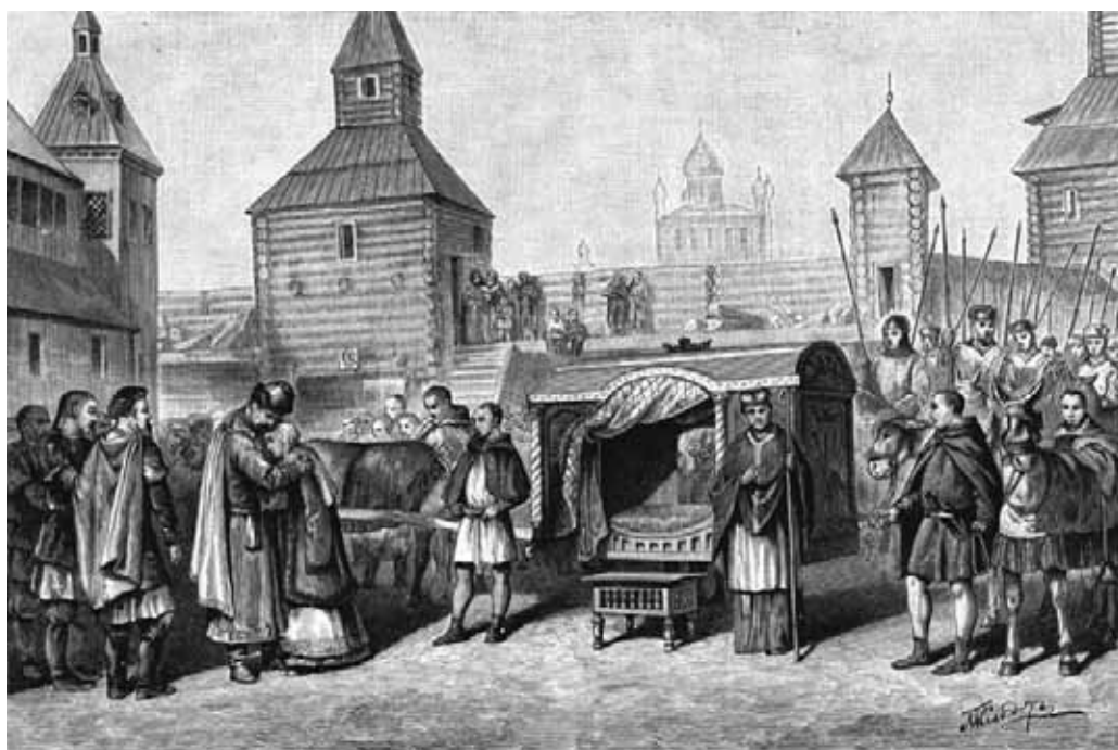
Від'їзд Анни Ярославни Петро Клодт, XIX ст.